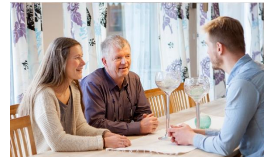
Velkommen til oss!